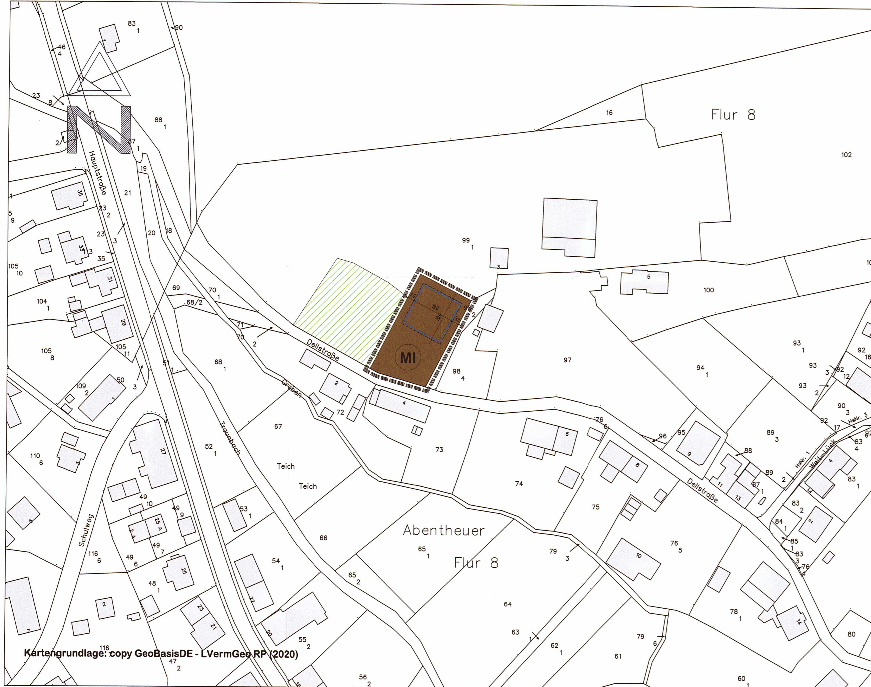
Kartengrundlage: copy GeoBasisDE - LVermGeo RP (2020)